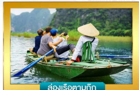
ล่องเรือตามก๊วก