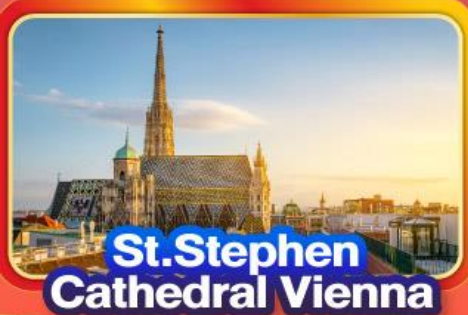
St. Stephen Cathedral Vienna