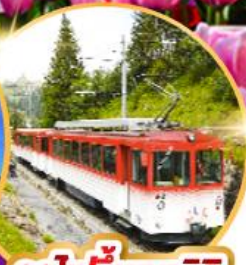
รถไฟขึ้นเขาริกิ

เดินทาง 01-10 เม.ย. 68 03-12, 04-13 พ.ค. 68