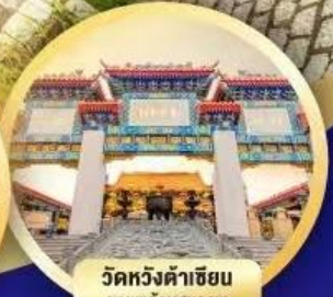
วัดหวังต้าเซียน เทพด้านสุขภาพ