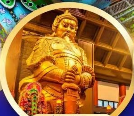
วัดเขกงหนิว เทพโชคลาภ การเงิน และธุรกิจ