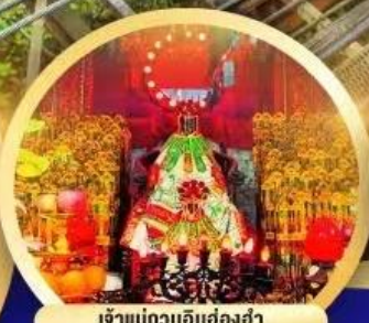
เจ้าแม่กวนอิมฮ่องกง นมัสการองค์เจ้าแม่กวนอิมที่มีอายุกว่า 600 ปี