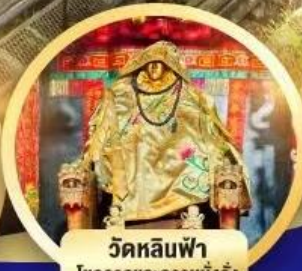
วัดหลินฟ้า โชคลาภและความมั่งคั่ง