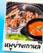
นุ่งจางเกาหลี่