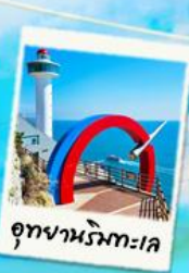
อุทยานริมหทะเล