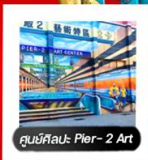
ศูนย์ศิลปะ Pier-2 Art