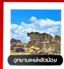
อุทยานแห่งชาติวู้ถง