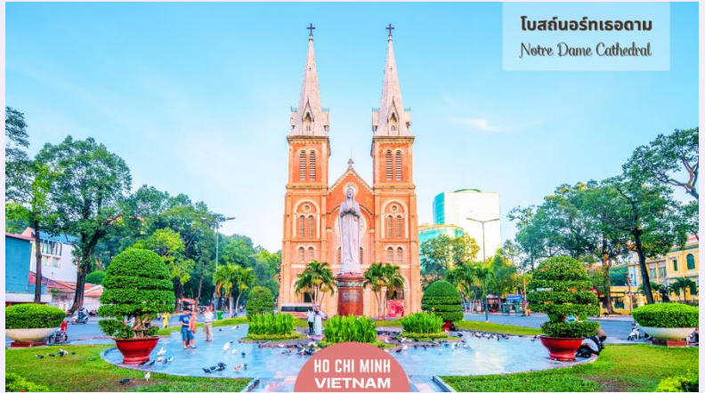
โบสถ์นอร์ทเทอดาม Notre Dame Cathedral

ตาม เป็นอัญมณีทางสถาปัตยกรรมอันงดงามที่มีความสำคัญทาง ประวัติศาสตร์ และวัฒนธรรม วิหารแห่งนี้สร้างขึ้นในยุคอาณานิคมฝรั่งเศส และเป็นสัญลักษณ์ของมรดกอันมั่งคั่งและความศรัทธาอันยาวนานของชาวเมืองไซงอน วัสดุที่ใช้ก่อสร้างล้วนนำเข้ามาจากฝรั่งเศส เป็นการผสมผสานอิทธิพลระหว่างยุโรปและเวียดนามอย่างลงตัว ความสมบูรณ์ของโครงสร้างเป็นข้อพิสูจน์ถึงคุณภาพของวัสดุเหล่านี้ รวมถึงอิฐสีแดงที่แข็งแรงในส่วนหน้าของอาคารซึ่งมีความวิจิตรสวยงาม และยอดแหลมที่สูงตระหง่าน ภายในวิหารยังได้รับการออกแบบให้รองรับผู้คนได้ประมาณ 1,200 คน