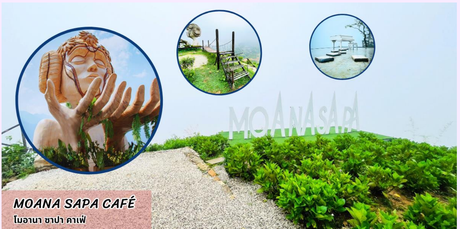
MOANA SAPA CAFÉ โมอานา ซาปา คาเฟ่

นำท่านเช็คอินแลนด์มาร์คแห่งใหม่ของซาปา โมอาน่า ซาปา คาเฟ่ (MOANA SAPA CAFÉ) จำลองไฮไลท์ของที่เที่ยวแต่ละที่มารวมไว้ให้ท่านได้ถ่ายรูปท่ามกลางบรรยากาศที่อบอุ่นไปด้วยภูเขา ให้ท่านอิสระเลือกซื้อเครื่องดื่ม และเพลิดเพลินกับสายหมอกจางๆ พร้อมกับบรรยากาศสุดฟิน อิสระให้ถ่ายภาพตามอัธยาศัย