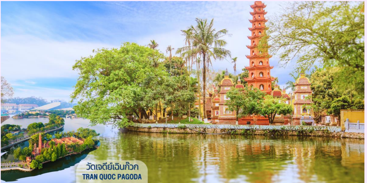
วัดเจดีย์เงินก๊วก TRAN QUOC PAGODA

จะมีขนาดเล็กลงตามความสูง ที่ช่องหน้าต่างของแต่ละชั้นจะเป็นที่ประดิษฐานของประติมากรรมพระพุทธรูป อมิตาภ พุทธเจ้า ตามความเชื่อของพุทธมหายาน ซึ่งมองเห็นเด่นชัดจากภายนอก ไล่เรียงขึ้นไปตรงกัน ตัวเจดีย์ก่อสร้างด้วยอิฐ สีแดง โข่วให้เห็นการซ้อนของอิฐ ชั้นล่างด้านหน้าจะมีแท่นสำหรับให้นักท่องเที่ยวบูชา ภายในมีจารึกประวัติความ เป็นมาทั้งของเจดีย์และพระศรีศากยมุนีปางปรีนิพพานที่ทำด้วยทองคำ