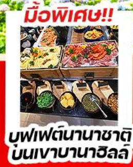
มือพิเศษ!! บุฟเฟ่ต์นานาชาติ บันเฆาบานาฮิลล์