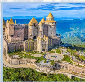
ปราสาทจันทร์