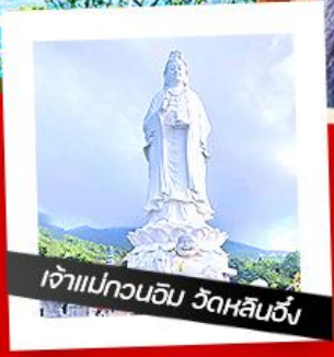
เจ้าแม่ทวนอิม วัดหลินอึ้ง

พักผ่อน บานาฮิลล์ 1 คืน Mercure Danang French Village