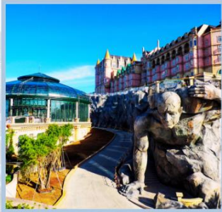
โถง Eclipse Square