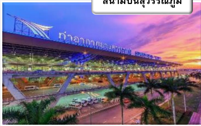
สนามบิสสุวรรณภูมิ

เวลา 19.00 น. พร้อมกันที่ สนามบิสสุวรรณภูมิ อาคารผู้โดยสารขาออกระหว่างประเทศแคนเตอร์ สายการบินไทยแอร์เวย์เจ้าหน้าที่คอยให้การต้อนรับ ดูแลด้านเอกสาร เช็คอิน และสัมภาระในการเดินทาง