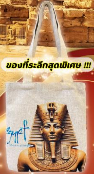
ของที่ระลึกสุดพิเศษ !!!