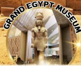
ครบ 3 พิพิธภัณฑท์ในทริปเดียว !!!