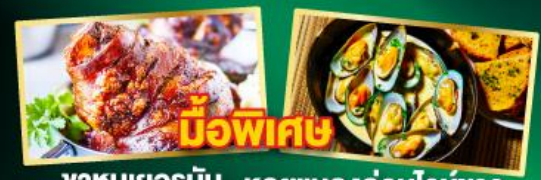
ขาหมูเยอรมัน หอยแมลงภู่อินจาว