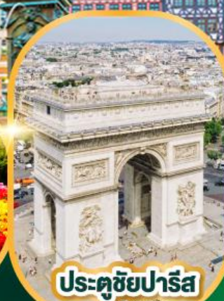
ประตูชัยปารีส