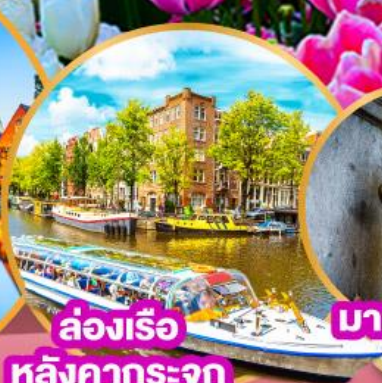
ล่องเรือ หลังคากระจก