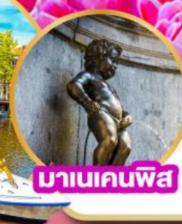
มานเนคินพีส