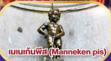
แมนเนกันพีส (Manneken pis)