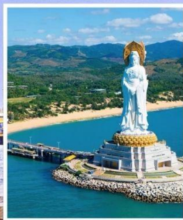
เจ้าแม่กวนอิม หนานซาน