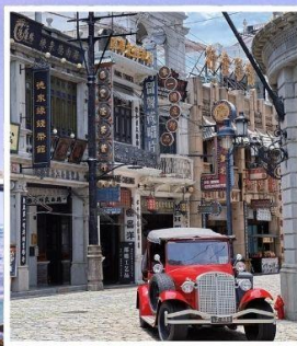
โรงถ่ายภาพยนตร์ เฟิงเสี่ยวกั๋ง