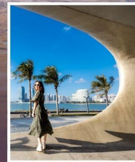
ห้องสมุดหยุนตง