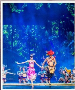
SANYA ROMANCE PARK