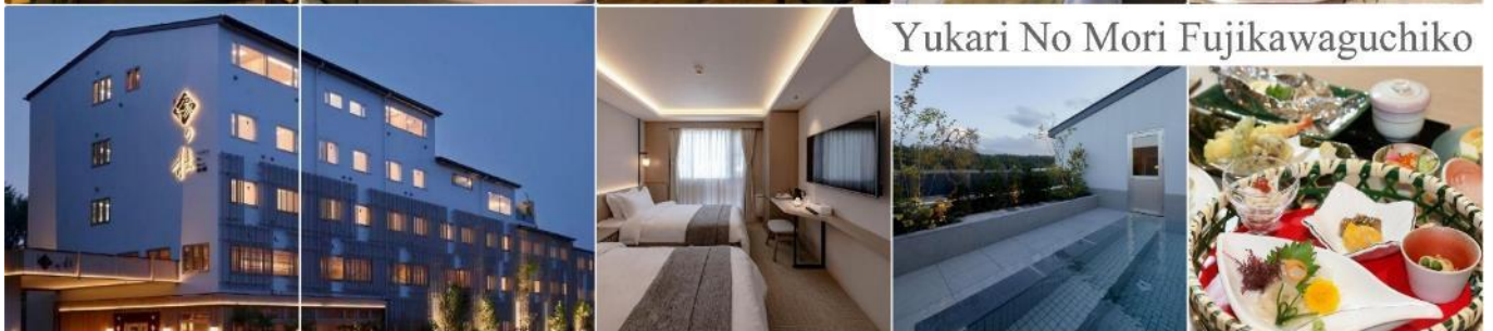
Yukari No Mori Fujikawaguchiko

วันที่สี่ จังหวัดยามานาชิ – การเรียนพิธีชงชาญี่ปุ่น – กรุงโตเกียว – ชมแมวยักษ์3มิติ พร้อมช้อปปิ้ง ย่านชินจูกุ – ย่านโอไดบะ – ห้างไดเวอร์ซิตี