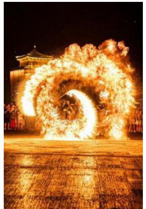
Melted Metal-Firework Show

นำท่านชม โชว์ดอกไม้ไฟเหล็กหลอม การแสดงทางวัฒนธรรมที่จับต้องไม่ได้ “ดอกไม้ไฟเหล็กหลอม” เป็น การจำลองพลุที่อยู่บนท้องฟ้ามาอยู่ในระดับสายตาให้เหล่าผู้ชมได้สัมผัสความอลังการด้วยแสง สี และ ความสวยงามอันน่าทึ่งของ 1 ในวัฒนธรรมจีนที่สืบทอดกันมาในแถบพื้นที่ตอนใต้ของแม่น้ำเหลือง(ฮวงโห) การแสดงดอกไม้ไฟเหล็กหลอม เกิดขึ้นมายาวนานกว่าพันปีแล้ว โดยช่างตีเหล็กได้ค้นพบความงามหลุด จินตนาการนี้จากการทดลองโยนเหล็กหลอมสาดขึ้นสู่ท้องฟ้า ซึ่งหากมองจากไกลๆ จะดูเหมือนประกายไฟ สีทองอันแสงงดงาม และยังเปรียบเหมือนกับดวงดาวที่ลอยเต็มฟ้า ซึ่งเป็นแนวความคิดที่คล้ายกับดอกไม้ ไฟในปัจจุบันนั่นเอง และด้วยการพัฒนาไปไกลของยุคสมัย ทำให้สามารถจัดแสดงได้ด้วยความปลอดภัยไม่ เป็นอันตรายอย่างแต่ก่อนที่ต้องอาศัยผู้เชี่ยวชาญถึงสามารถจัดการแสดงนี้ขึ้นได้ ดอกไม้ไฟเหล็กหลอมมัก จัดแสดงขึ้นในเทศกาลตรุษจีน เพื่อเฉลิมฉลองการขึ้นปีใหม่ของจีนด้วยความยิ่งใหญ่ ตระการตาและยังถือ เป็นการแสดงเพื่ออวยพรให้เกิดความเป็นสิริมงคลนั่นเอง (หากมีฝนตกจะไม่สามารถชมการแสดงได้)