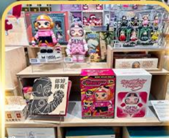
ช้อปปิ้ง Popmart ห้างญี่ปุ่น อิน77