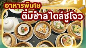
อาหารพิเศษ ติ่มซำสไตล์ซูโจว