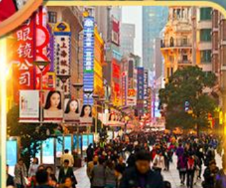
เดินเล่นถนนหนานจิง