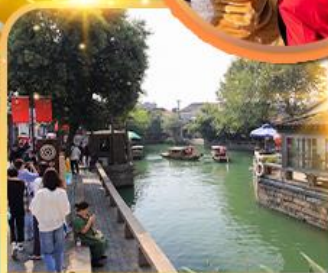
ท่องเที่ยวชมเมืองโบราณผิงเจียง