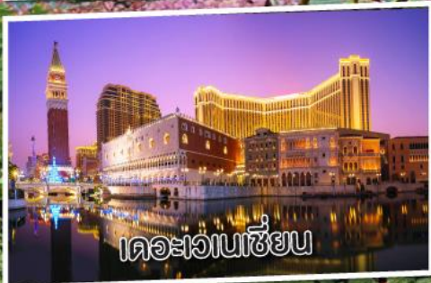
เดอะเวเนเซียน