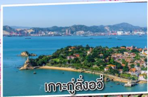
เกาะกู่ลิ่งอวี่