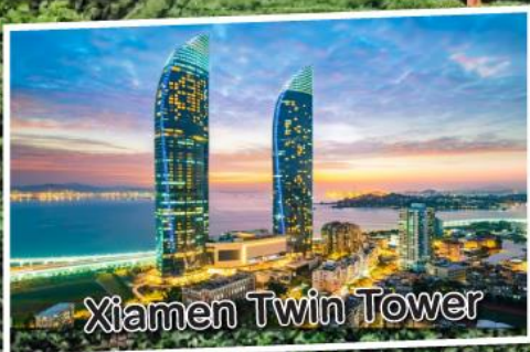
Xiamen Twin Tower