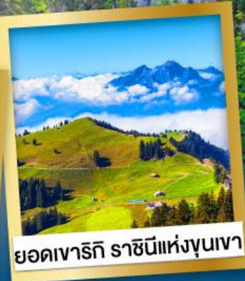
ยอดเขารัทธิ ราชนิแห่งขุนเขา