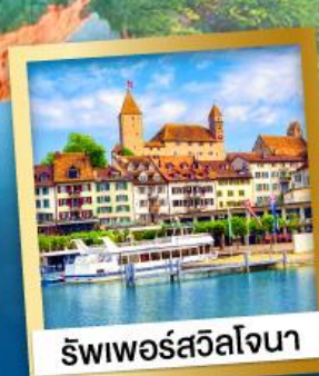
รพเพอร์สวิลโจนา