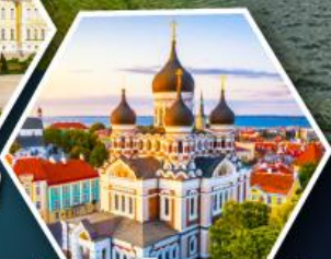
วิหารอเล็กซานเดอร์ นอฟสกี (ทาลลินน์)

• ล่องเรือซิลเซียไลน์ข้าม จากเอสโตเนียสู่ฟินแลนด์ • เข้าชมโบสถ์หิน Rock Church