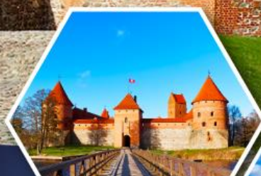
ปราสาททราโค