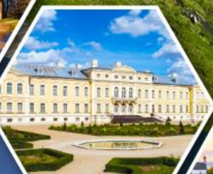
พระราชวังรินดาเล