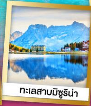
ทะเลสาบมิซูริน่า