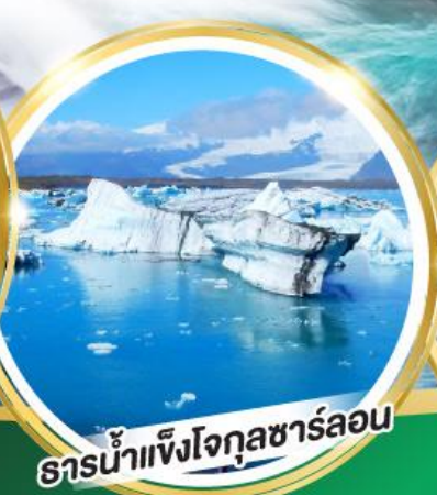
ธารน้ำแข็งโจกุลซาร์ลอน