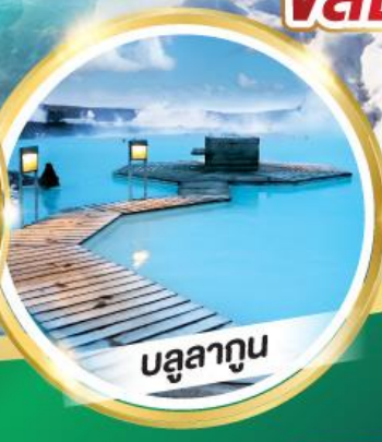
บรูลาทูน