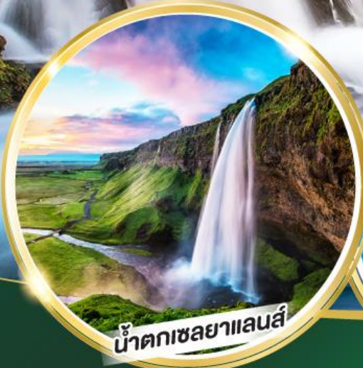
น้ำตกเซลยาแลนส์