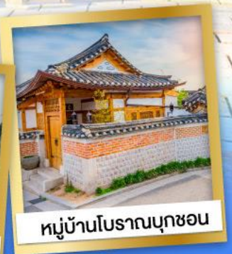
หมู่บ้านโบราณบุกซอน