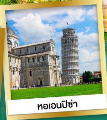
หออนปิซ่า