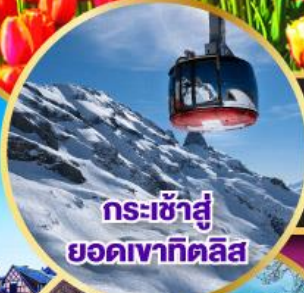
กระเช้าสู่ยอดเขากิตติส