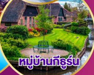
หมู่บ้านทึร์น