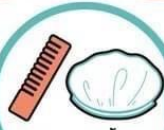
หมวกอาบน้ำ หวี