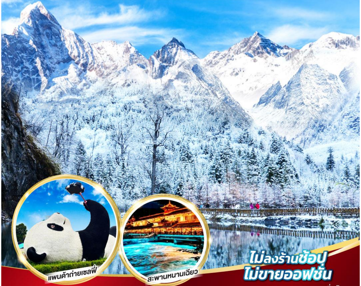
แพนด้ายักษ์

หมี่แพนด้ายักษ์ ช้อปปิ้ง POP MART 5วัน 4คืน