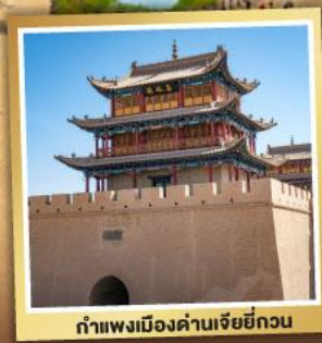
กำแพงเมืองด่านเจียหยี่กวน