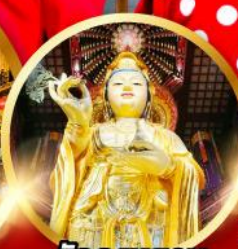
วัดฉงหยวน