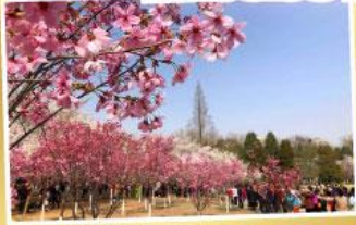
ซากุระ สวนหยูหยวนถาน

จ่ายราคาเดียว..เที่ยวเต็มอิ่ม ..ไม่ลงร้านช้อปปิ้ง