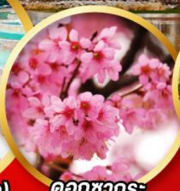
ดอกซาคุระ