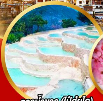
ธารน้ำหนาว (เป็ลู่ยโก)