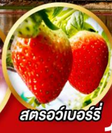
สตรอว์เบอร์รี่