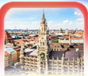
จัตุรัสมาเรียนพลักซ์