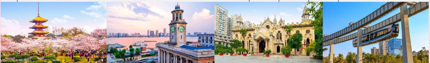
สวนชาทุระทะเลสาบโมซานตงหู