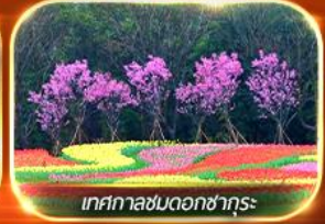
เทศกาลชมดอกซากุระ

ตระการตาหุบเขาเทวดาวังเซียนกู่ เซ็คอินที่เที่ยงใหม่