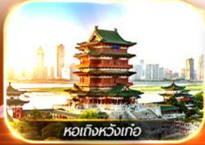
หอเท็งหวังเทื่อ