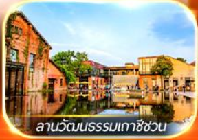
ลานวัฒนธรรมเทาซันชว่น