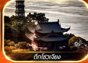
ตึกโซวเจียง