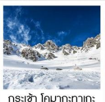
กระเช้า โคมากะทาเกะ