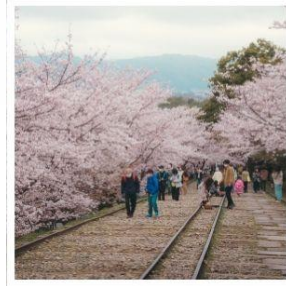
เคอะเคะ อินโคลน์