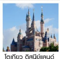
โตเกียว ดิสนีย์แลนด์