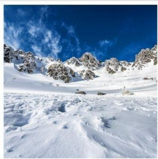
กระเช้าลอยฟ้าโคมากะทาเคะ