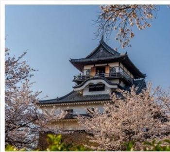
ปราสาทอินุยามะ