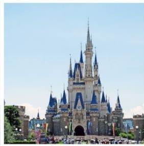
โตเกียว ดิสนีย์แลนด์ สวนฮานาโมโมะ โนะ ซาโตะ