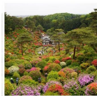
วัดชิโอะฟูเนะ คันนงจิ

โตเกียวดิสนีย์แลนด์ ดินแดนในฝันของคนทั้งโลก ฮานาโมโมะ โนะ ซาโตะ ดอกท้อกลางหุบเขาที่รอคุณมาเยือน ทางรถไฟสายเก่า เคอะเคะ อินโคลน์ 1 ในจุดชมซากุระที่สวยงามแห่งเกียวโต ขึ้นกระเช้าที่สูงที่สุดในญี่ปุ่น โคมากะทาเคะ กับแอ่งเทือกเขาสุดอัศจรรย์เช่นโจจิชิ เซอร์ก ปราสาทอินุยามะ 1 ใน 12 ปราสาทดั้งเดิมกับทิวทัศน์อันแสนสวยงาม ชิโอะฟูเนะ คันนงจิ วัดแห่งดอกไม้สด unseen ที่ไม่ควรพลาด พักออนเซ็น 2 คัน!!! // อาหารพิเศษ...บุฟเฟ่ต์ปังย่าง, บุฟเฟ่ต์ซาบู, บุฟเฟ่ต์ซาปู กรุ๊ปสบายๆ เพียง 20 ท่านเท่านั้น!!!