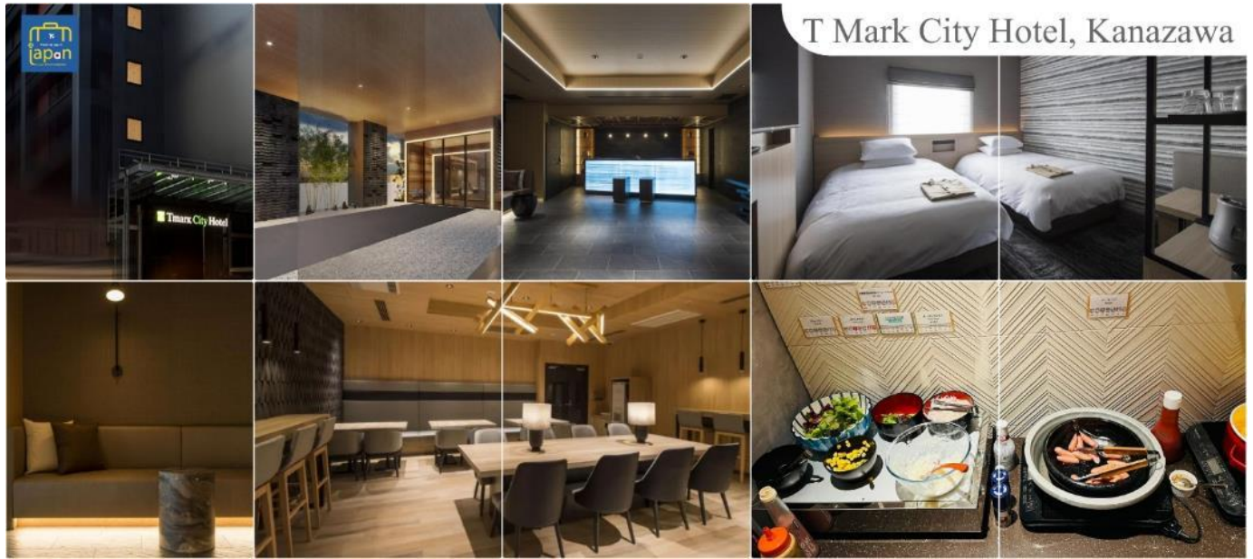
T Mark City Hotel, Kanazawa

พักที่ TMARK CITY HOTEL, KANAZAWA หรือเทียบเท่าระดับเดียวกัน