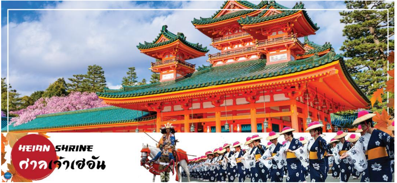
HEIAN SHRINE ศาลเจ้าเฮอัน