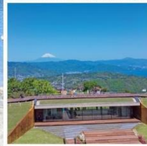
มิโระ คาเฟ่321