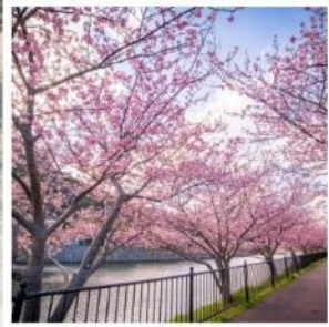
เทศกาลคาวาซุ ซากุระ