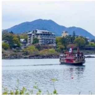
ล่องเรืออปปะระะ