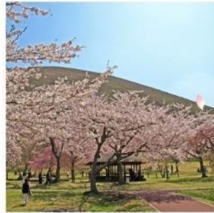
ซากุระ โนะ ซาโตะ