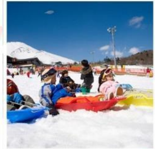
ลานสกีเยติ