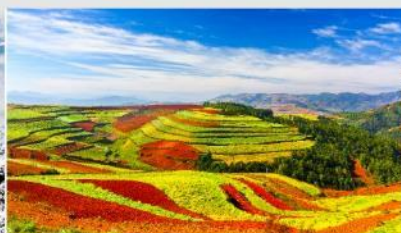
แผ่นดินสีแดง