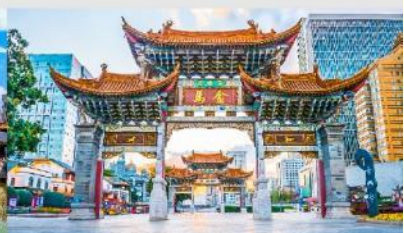
ประตูม้าทอง ไถ่หยก

*ทางบริษัทฯ ขอสงวนสิทธิ์ในการสลับโปรแกรมทัวร์ตามความเหมาะสมขึ้นอยู่กับสถานการณ์หน้างาน โดยคำนึงถึงผลประโยชน์ของลูกค้าเป็นสำคัญ