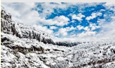
ภูเขาหิมะเจี๋ยจื่อ