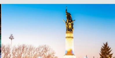
อนุสาวรีย์ผึ้งหง