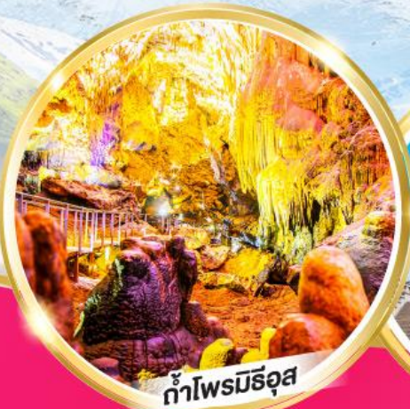
ถ้ำไฟรมีริออส