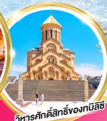
วิหารศักดิ์สิทธิ์ของทบิลีซี