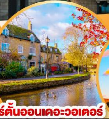
เบอร์ตันออนเดอะวอเตอร์