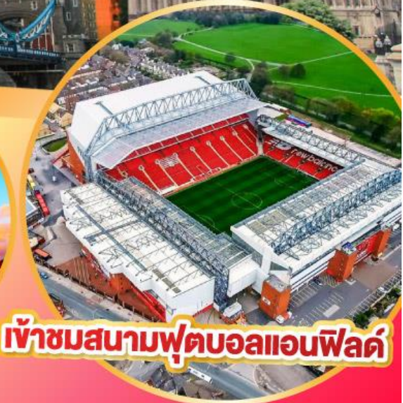
เข้าชมสนามฟุตบอลแอนฟิลด์

เมนูสุดพิเศษ!! Fish & Chips อาหารไทย และ กัดตาคารคัง Four Season