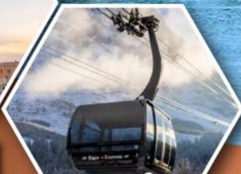
กระเช้าขึ้นสู่ ยอดเขาจุงเฟรา