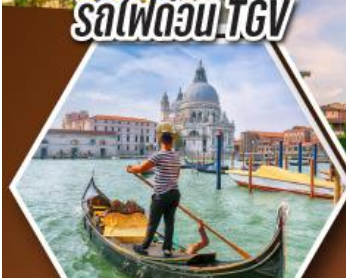
ล่องเรือคอนโดล่า บนเกาะเวนิส