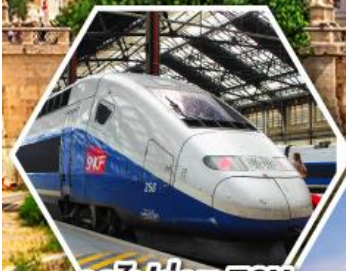
รถไฟด่วน TGV