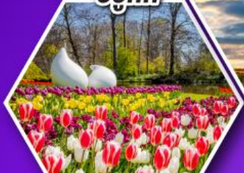
เทศกาลดอกไม้เคอเคนฮอฟ