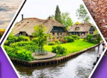
หมู่บ้านกีร์ฮิน