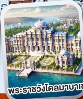
พระราชวังโดลมาบาเช่