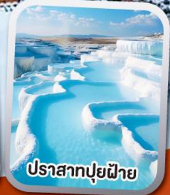
ปราสาทปุยฝาย