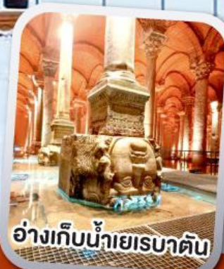
อ่างเก็บน้ำเยเรบาตัน