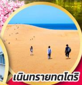
เนินทรายทตริ

ขอพรเทพเจ้าแห่งความรัก พร้อมชมซากุระ ณ ศาลเจ้าอิซุโมะ โทชะ