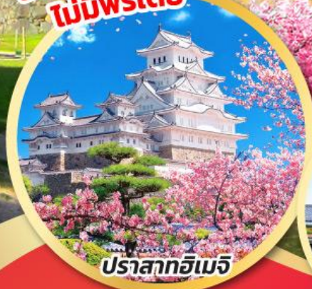
ปราสาทฮิเมจิ