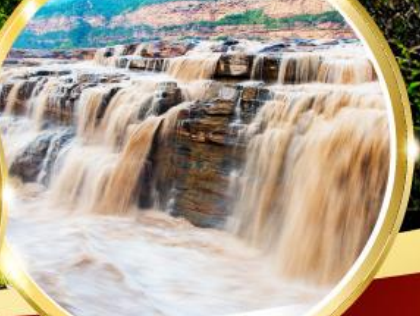
น้ำตกหูโง่