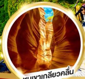
หุบเขาเกลียวคลื่น