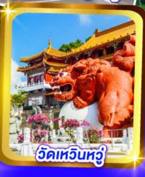
วัดหัวหน่วง