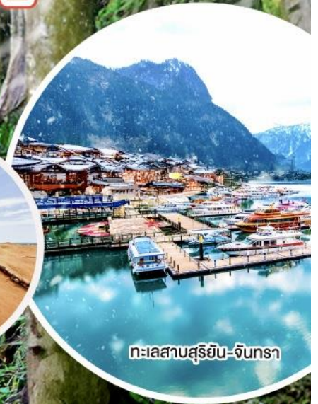
ทะเลสาบสุริยัน-จันทรา