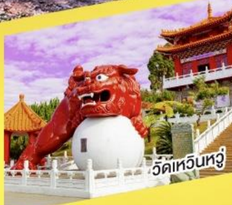
วัดหัวหนางู