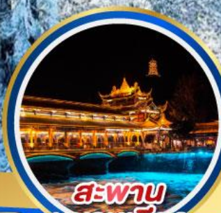
สะพาน หนานเจียว