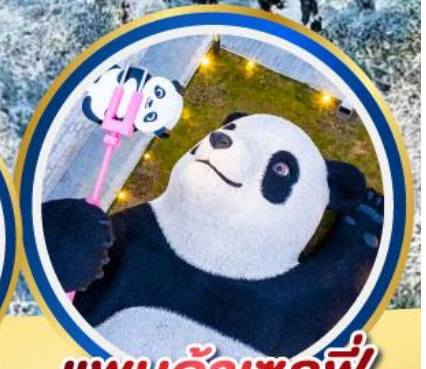
แปนต้าเซลฟ์